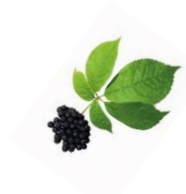
ELEUTHEROCOCCUS Energiaival tölt fel

ENDESSENCE – ENDEMIKUS SZIBÉRIAI NÖVÉNYEK AKTÍV HATÓANYAGAIBÓL ÁLLÓ KOMPLEX