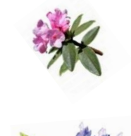
RHODODENDRON Növeli a bőr feszességét