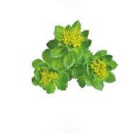
RHODIOLA QUADRIFIDA Erősíti a helyi immunitást