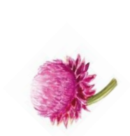
LEUZEÁ Javítja a sejtek anyagcseréjét